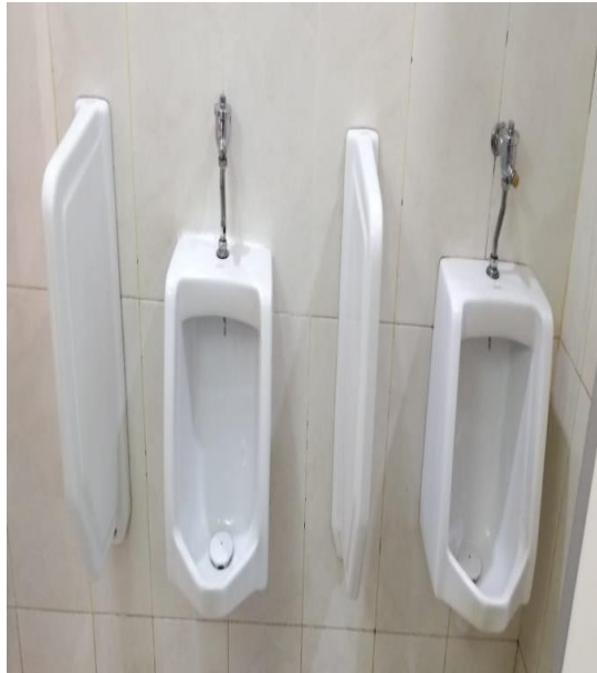
R. Toilet Pria Paviliun Garuda