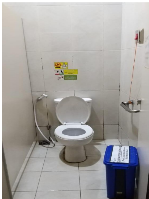
Toilet Khusus Difabel Pav. Garuda