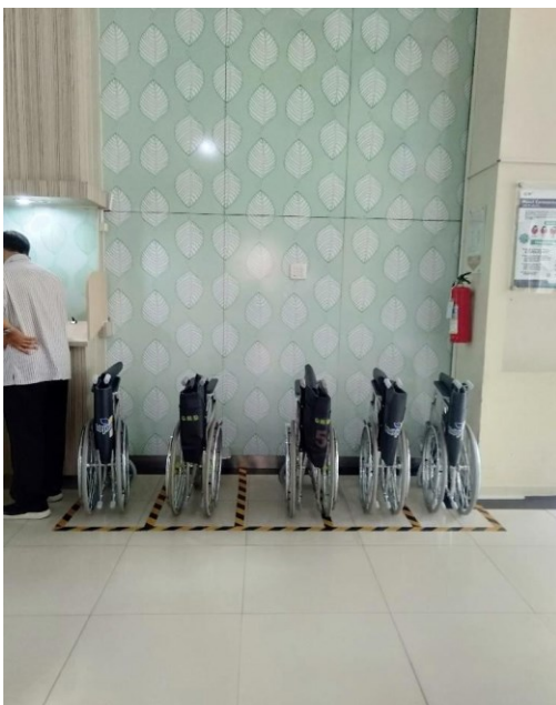
Tempat Kursi Roda Pav Garuda