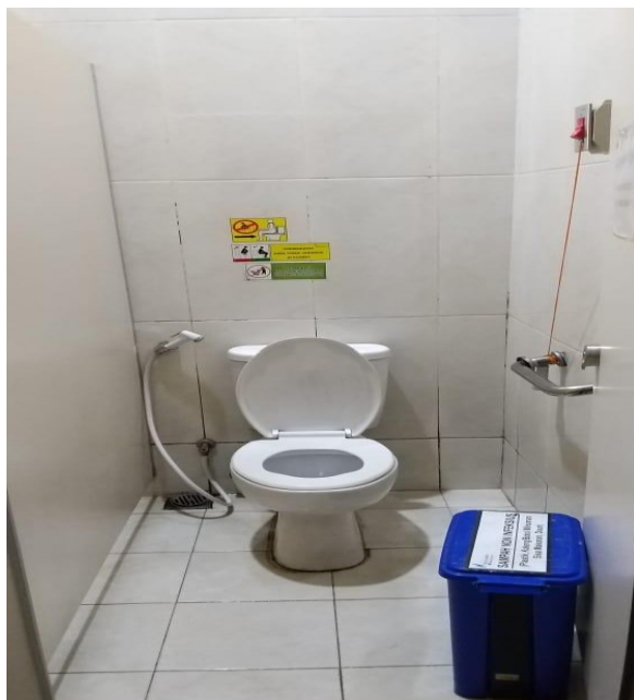
R. Toilet Wanita Paviliun Garuda