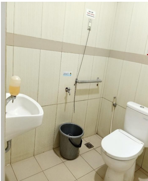
Toilet Difabel Gedung Onkologi