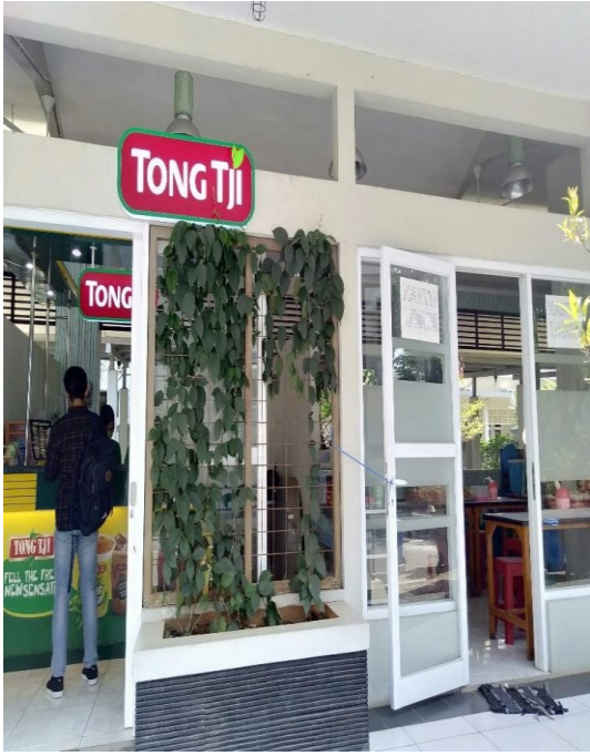
Kantin untuk Pengunjung Gedung Rawat Jalan Merpati