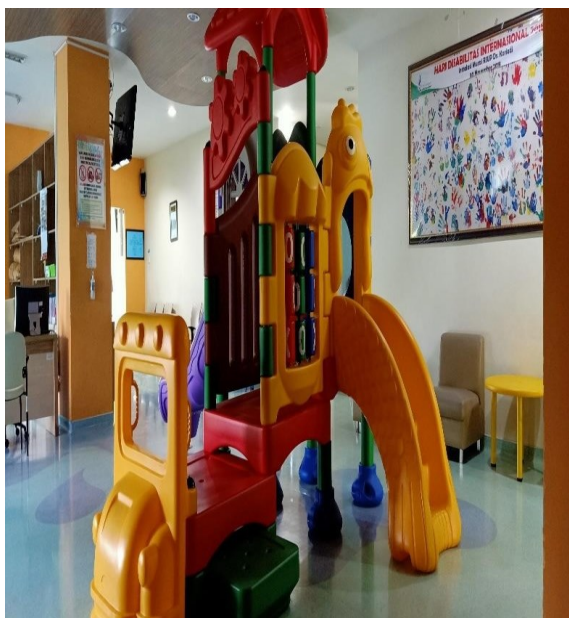
Arena Bermain Anak di R. Rehabilitasi Medik & Tumbuh Kembang Anak