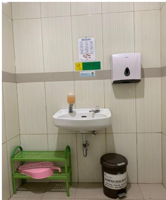
Wastafel, Toiletress, Air Bersih (Tissue, Sabun dll) Gedung Onkologi