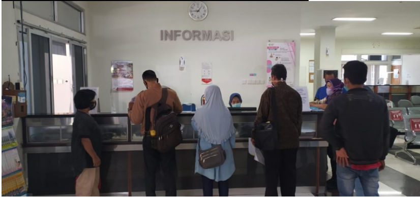
R. Informasi Rawat Jalan di Gedung Merpati