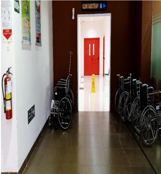
Tempat Kursi Roda Gedung Onkologi