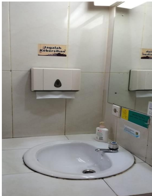
Wastafel, Tissue, Sabun, Air Bersih