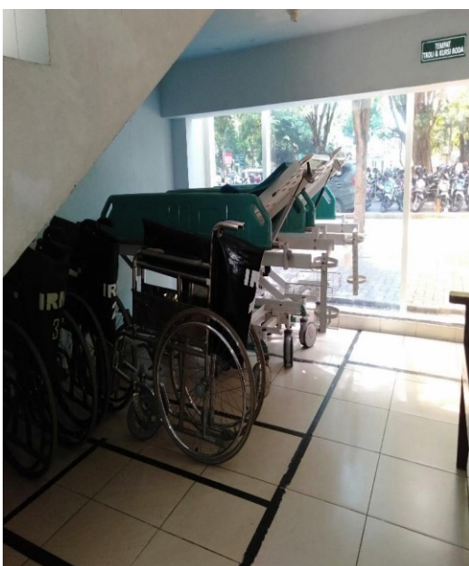
Tempat Kursi Roda R. Rehabilitasi Medik & Tumbuh Kembang Anak