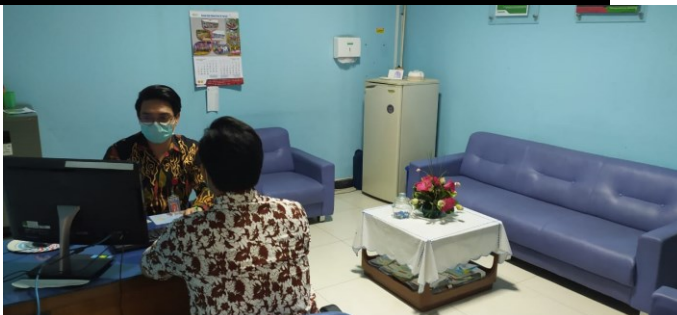
R. Pengaduan Rawat Jalan di Gedung Merpati