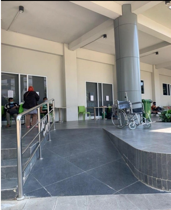
Step Lobby/Ramp bagi Pengguna Kursi Roda Gedung Onkologi