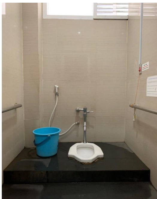
Toilet Jongkok di Gedung Rawat Jalan Merpati