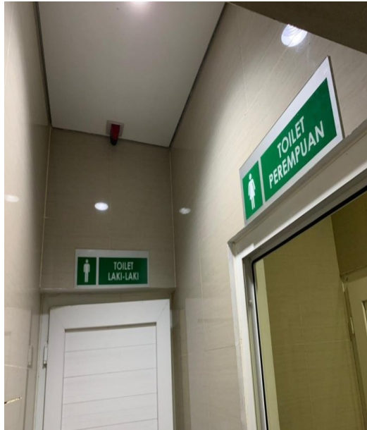
Toilet Pengunjung di Gedung Rawat Jalan Merpati