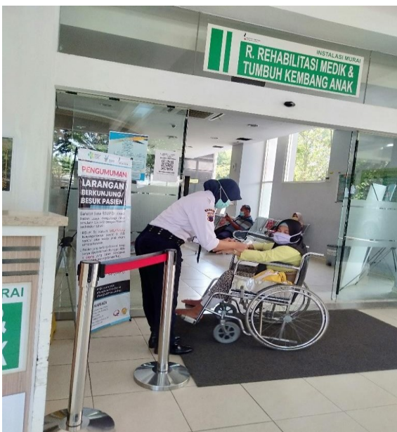
Petugas Khusus R. Rehabilitasi Medik & Tumbuh Kembang Anak