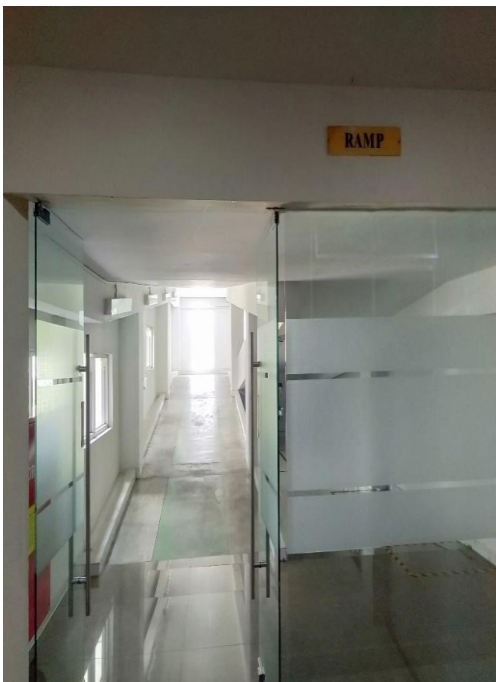
Step Lobby/Ramp bagi Pengguna Kursi Roda Pav. Garuda