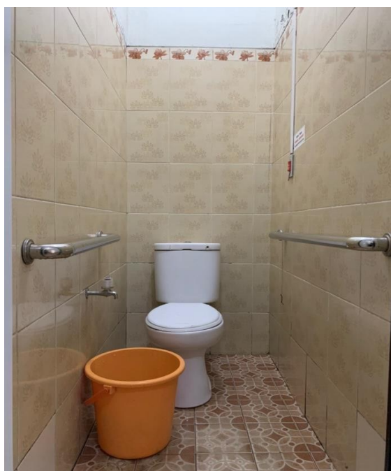
Toilet Khusus Difabel Gedung Rawat Jalan Merpati