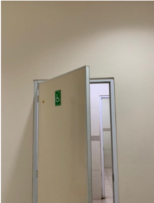
Toilet Difabel Gedung Onkologi