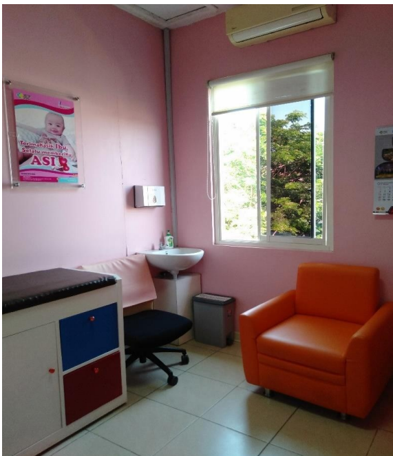
R. Laktasi di R. Rehabilitasi Medik & Tumbuh Kembang Anak