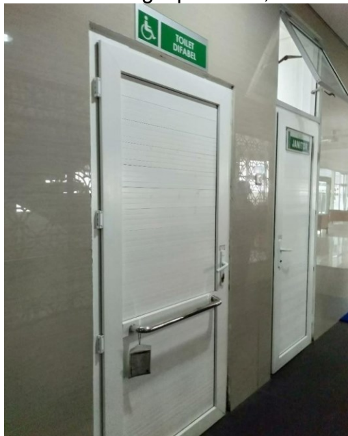
Toilet Khusus Difabel Gedung Rawat Jalan Merpati