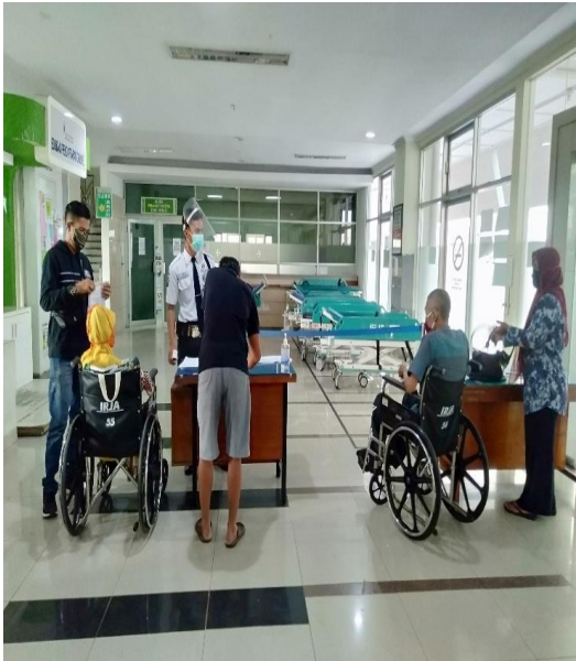
Loket Khusus Gedung Rawat Jalan Merpati