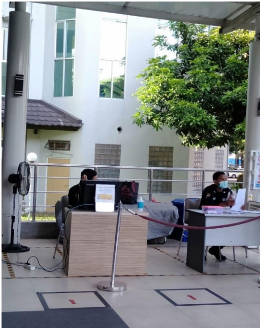
Petugas Khusus gedung Garuda