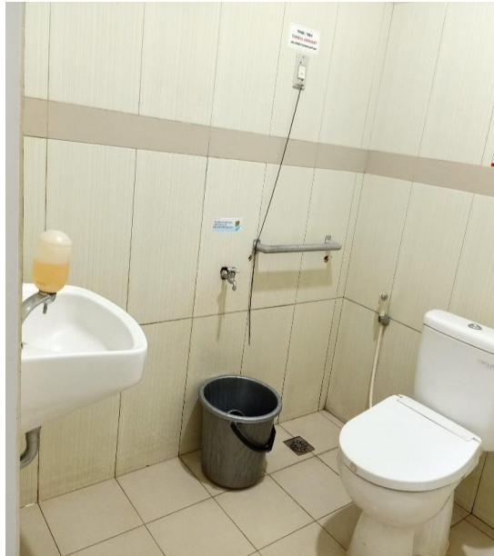
Toilet Gedung Onkologi