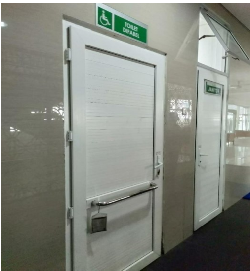
Toilet Khusus Difabel Gedung Rawat Jalan Merpati