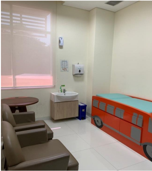
Ruang Laktasi Gedung Onkologi