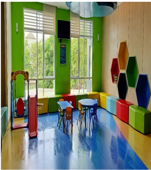
Arena Bermain Anak Gedung Onkologi