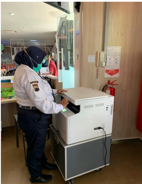
Fasilitas Mesin Fotokopi Gedung Onkologi