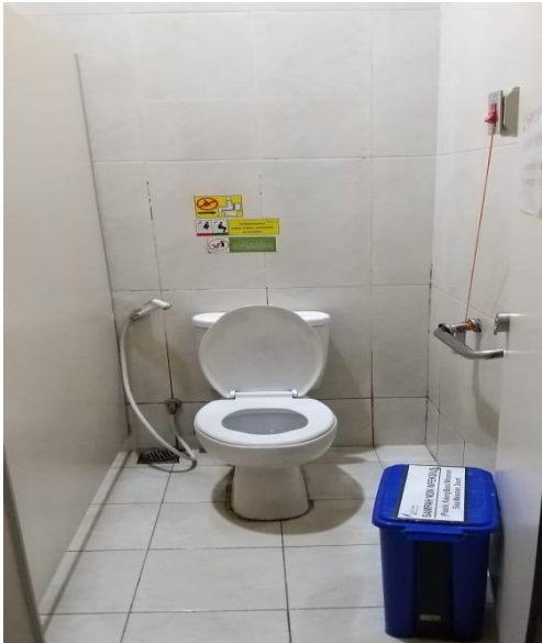
Toilet Khusus Difabel Pav. Garuda