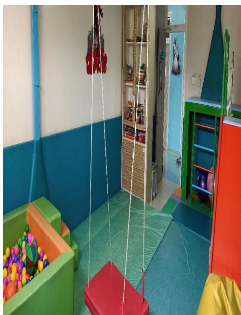
Arena Bermain Anak di R. Rehabilitasi Medik & Tumbuh Kembang Anak