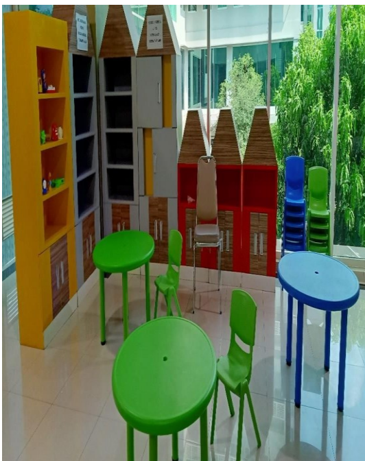
Arena Bermain Anak Pav. Garuda