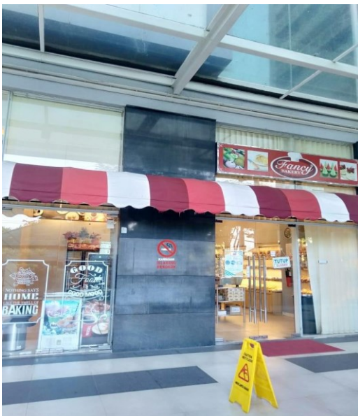
Kantin Pav. Garuda