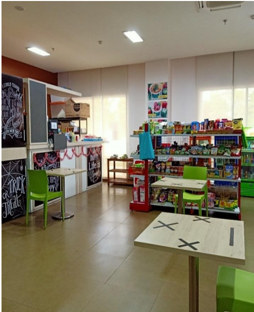
Kantin Gedung Onkologi