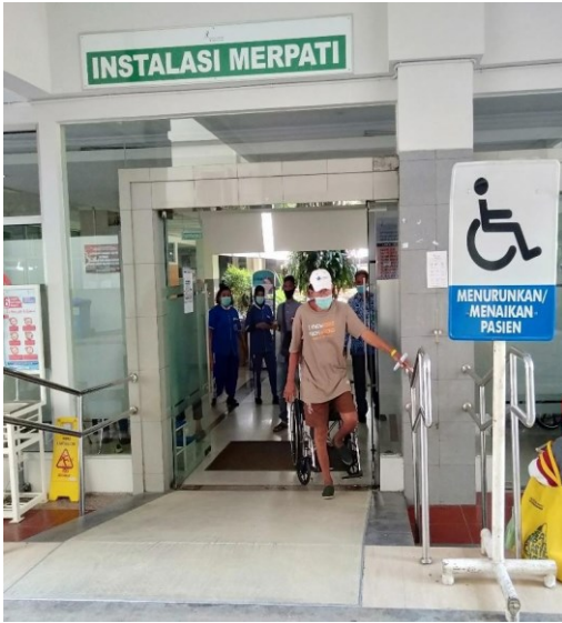
Step Lobby/ Ramp Bagi Pengguna Kursi Roda Gedung Rawat Jalan Merpati